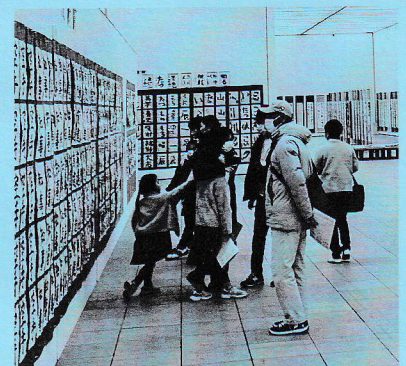
第6回全国小中学生書道チャンピオン大会 作品展会場風景